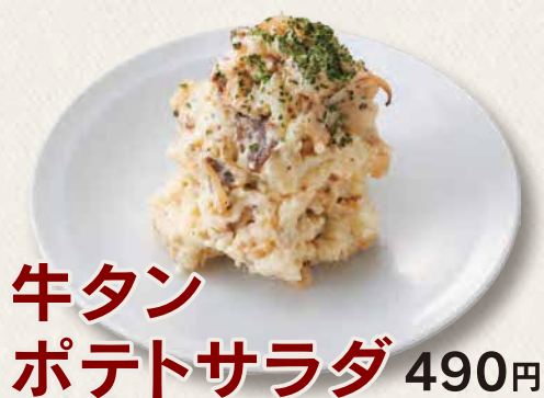
牛タン ポテトサラダ 490円