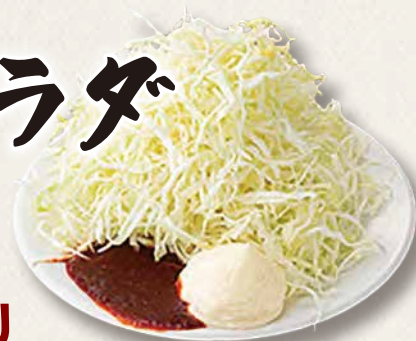
山盛り キャベセンサラダ 290円