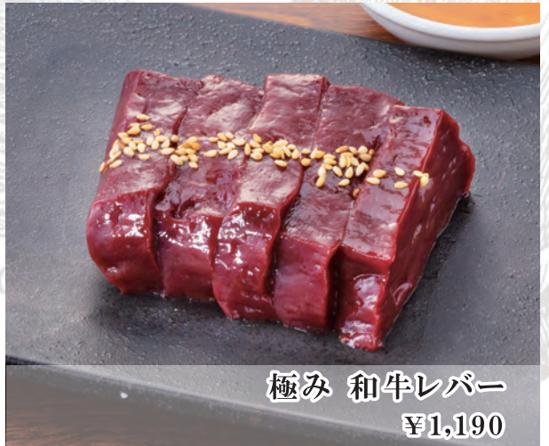
極み 和牛レバー ¥1,190