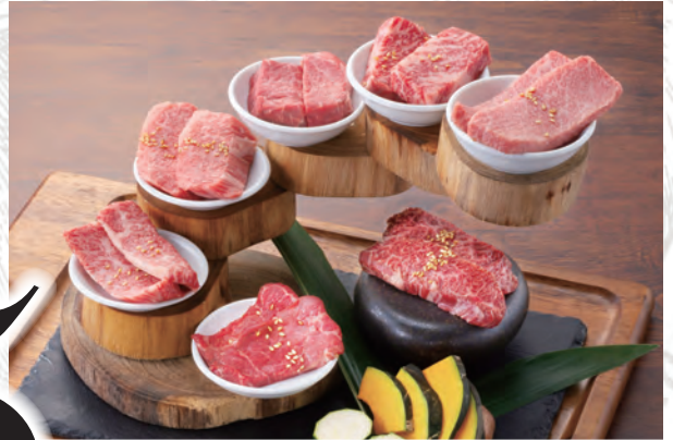
USHIHACHI 一頭盛り 7 種 (一人前) ¥3,490 写真は2人前です