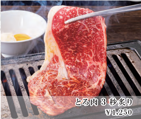
とろ肉 3 秒炙り ¥1,250