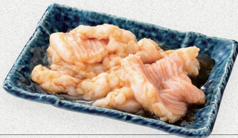
和牛 生白ホルモン (塩・タレ・味噌) 六九〇円