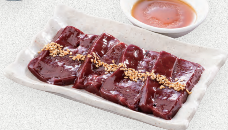
極上 バー焼き 九五〇円