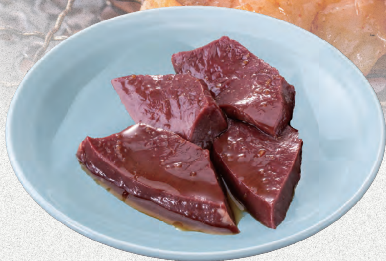
和牛 厚切りハツ (塩・タレ・味噌) 七九〇円